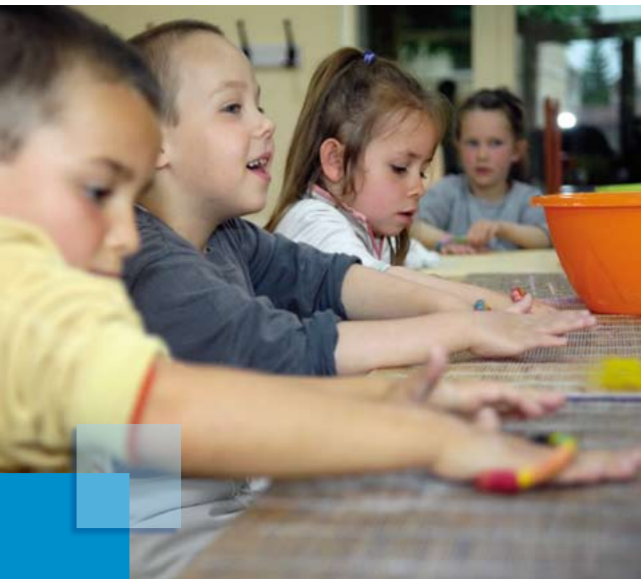
Atelier feutre à Villiers-en-Plaine

Pour moi et pour le Pôle régional des métiers d'art c'est quelque chose d'excessivement important, c'est pouvoir faire réintégrer les métiers d'art au cœur de la culture, leur redonner un peu la place qui leurs est dû normalement. Quand on regarde l'histoire du monde, l'histoire de nos civilisations, si on pouvait redonner un peu cette notion de culture à nos métiers d'art peut être que l'on pourrait avoir plus de jeunes et plus de gens qui attacheraient de l'importance à ces métiers.