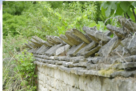
Mur du jardin médiéval