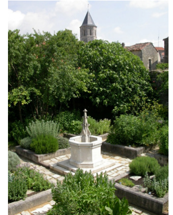
Le jardin médiéval