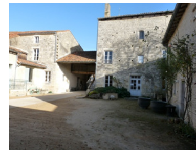
Cour intérieure de la Maison du Patrimoine de Tusson