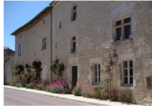
Le logis Marguerite d'Angoulême, Maison du Patrimoine de Tusson